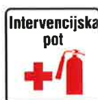
Znak za intervencijsko pot

Intervencijska pot mora biti označena s prometnim znakom (glej spodaj) ali označbami na vozišču "Intervencijska pot" v skladu s predpisi o prometni signalizaciji in prometni opremi na javnih cestah.