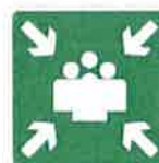
Znak za zbirno mesto (BS 5499)