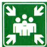
Znak za zbirno mesto (SIST ISO 3864)

Zbirno mesto se nahaja na ploščadi okoli večnamenskega nogometnega stadiona , ki ga je potrebno označiti z znakom zbirno mesto (glej spodaj):