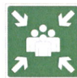
Znak za zbirno mesto (BS 5499)