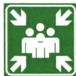
Znak za zbirno mesto (SIST ISO 3864)

Zbirno mesto se nahaja zunaj na zahodni strani objekta , ki ga je potrebno označiti z znakom zbirno mesto (glej spodaj):