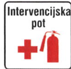
Znak za intervencijsko pot

Intervencijska pot mora biti označena s prometnim znakom (glej spodaj) ali označbami na vozišču "Intervencijska pot" v skladu s predpisi o prometni signalizaciji in prometni opremi na javnih cestah.