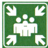
Znak za zbirno mesto (SIST ISO 3864)

Zbirno mesto se nahaja na parkirišču pred dvorano , ki ga je potrebno označiti z znakom zbirno mesto (glej spodaj):