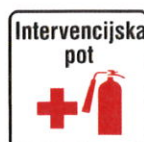
Znak za intervencijsko pot

Intervencijska pot mora biti označena s prometnim znakom (glej spodaj) ali označbami na vozišču "Intervencijska pot" v skladu s predpisi o prometni signalizaciji in prometni opremi na javnih cestah.